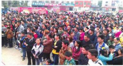
抽奖现场热闹非凡。