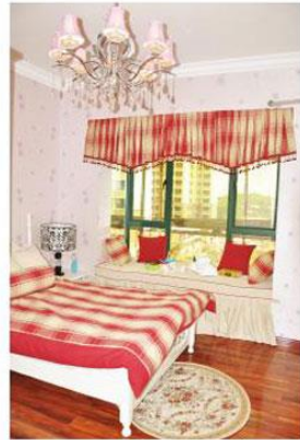
公园的综合实力和诚信态度,体现了公司“不怕苦,不畏难,全心全意为业主服务”的服务方针。金秋九月,丹桂飘香,富基·世纪公园之丹桂园——一个美丽温馨的公园之家向广大业主敞开怀抱。

持续九天的集中交房刚刚结束,业主们期盼而来,舒心而归,交房期间为了接待业主,公司人力资源部设专车接送、水果茶饮免费供应,孩子们可在游乐室自由玩耍,让他们真正感到宾至如归。此次交房已圆满落幕,期间反映了富基·世纪