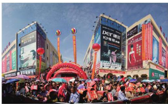
上万名平江民众参加开业庆典仪式。

双首层加十字连廊的建筑形式,引进国内知名建材品牌,将建材、家居、家具等关联性紧密业态进行科学规划:实行统一经营、统一管理;11000平米的酒店式公寓,7500平米商业配套设施、物流经营配套设施全方位配套;作为平江县人民政府10年内“唯一”规划建设建材市场,平江家居建材物流园秉持“六个第一”开发理念,为平江招商引资和专业市场的发展树立了良好典范;完善了城市配套,提升了城市品位,为平江乃至相邻县市群众享受购物便捷和价廉实惠作出了突出贡献。 此次盛大开业预示着一座平江乃至全国县域经济中品种最全、价格最优、环境最美、服务最好的专业家居建材市场已经扬帆起航,她开创了县域经济专业市场全新商业模式。