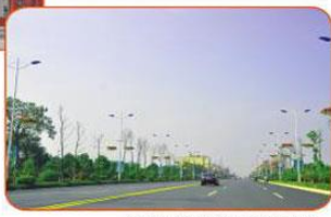
道路两旁的路灯上花盆争艳。

(4)健全公司法人治理机制，主动申请政府对企业经营所得的利润和利润用途进行审计、监督，实现健康发展。 (5)公司充分发挥员工的主