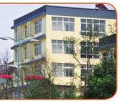
焕然一新的外立面。

立面翻新改造工作。建筑外立面的改造，不仅能解决建筑陈旧的外观与街道景观的不协调，提升城市的品味，还能促进当地经济的发展，解决当地农民工的就业问题，基于这样的考虑，经过公开招投标，最终获得了望城区两路两片外立面提质改造工程的合同的社会企业最终选择了交由当地政府运作，不但主动联系组织前往拥有先进的外立面改造经验的沿海地区考察，与政府一起出谋划策共同确定外立面改造的总体方案和策略，在执行过程也对外立面改造无私提供着人力协助和技术指导，却不从中获取一丝一毫的利益。因为在公司董事长看来，作为公益性的社会企业之所以区别于其它，就是因为社会企业的宗旨在于追求社会价值，推动社会管理创新，既然外立面更新能够给望城百姓的生活带来舒