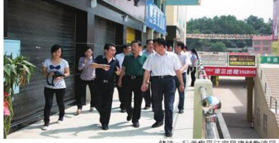
储波一行考察平江家居建材物流园。

储波在上世纪八、九十年代主政岳阳，22年后重回岳阳平江考察，恰逢平江家居建材物流园试营业开业10天，站在建材物流园市场中心转圈，放眼整个壮观的市场建筑，有序的高楼排列，干净整洁的街路路面，祥和温馨的购物环境，储波感到十分高兴。对平江家居建材物流园借鉴国内众多成功市场的经验，结合平江本地实际情况，采用双首层十字连廊建筑结构和街区与专业卖场