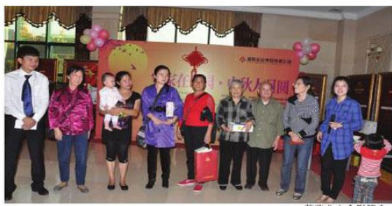
获奖业主合影留念。

本次活动由“两个有奖互动节目”、“宝贝才艺展示”、“幸运之星抽奖”等四部分组成。下午3时，伴着一曲《万事如意》带来的节日喜庆和美好祝福，活动拉开了序幕。整个会场的气氛也迅速活跃起来，精彩的儿童表演展现了小精灵们的多才多艺，幸运之星抽奖环节更是极大的调动了现场嘉宾们的参与热情，穿插于节目中的操作方式，不间断的点燃了业主们的兴奋点。随着活动的推进，本次活动设立的各个奖项纷纷花落各位嘉宾手中。活动进行到高潮部分，与现场嘉宾互动的“风花秋月”，以月为题材的吟诗和吟唱环节