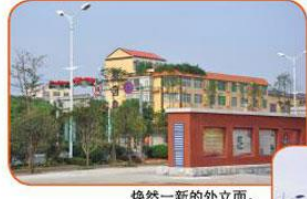
焕然一新的外立面。

获此殊荣，离不开社会企业的全体领导和员工，但更离不开社会各界尤其是望城区委区政府的大力支持。正如国务院研究室社会发展司司长张太平先生在指导我司发展时所说，社会企业能解决政府和市场都调节不了的问题，尤其是公共服务方面，但是没有政府的大力扶持，